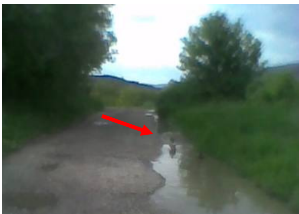
Az úton fürdőző Vadkacsák