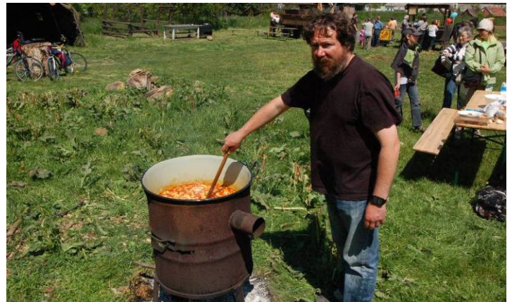
Lóri és Dühös