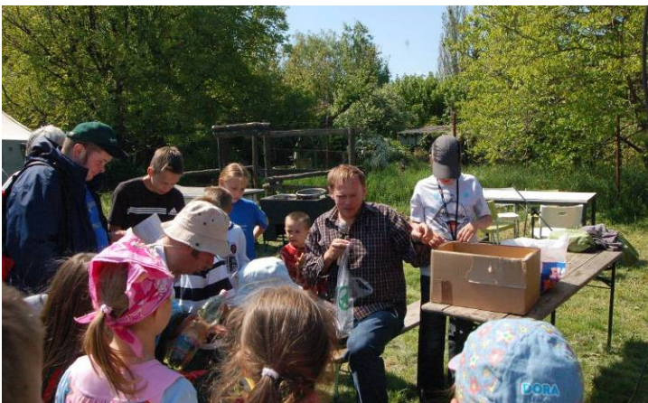
Tombol a tombola