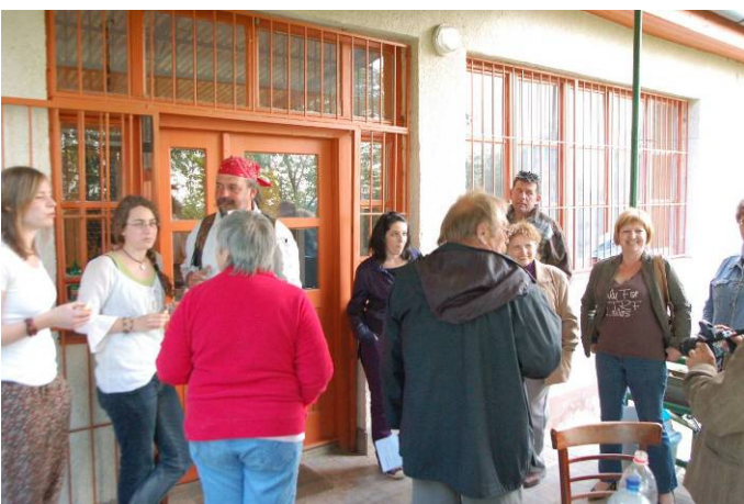
Mozi, vacsora, szomszédolás

A rendezvényt elsősorban az Óbudai Önkormányzat támogatta az Óbudai Kulturális Központon keresztül, de külön köszönetet mondunk az Eleven Park Kft-nek, az MVM-nek és a Deap and Peak nyomdának is. A Menedékház utcai pihenőházat az Önkormányzat bocsátotta rendelkezésünkre. Köszönjük a helyi lakóknak az előkészítésben és lebonyolításban vállalt szerepet és a rendezvényen tanúsított aktivitását. A rendezvények összességében kb. 180 felnőttet és 80 gyermeket mozgató meg.