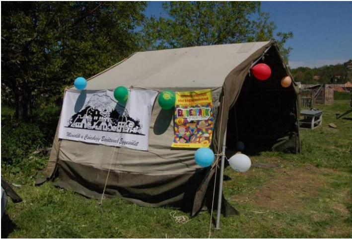
Az egyesület sátra

A Menedék a Csúcshegy Barátainak Egyesület időszakos kiadványa I. évf. 1. sz. 2011. június