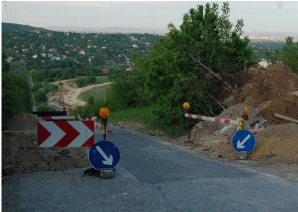
A Virágosnyereg út