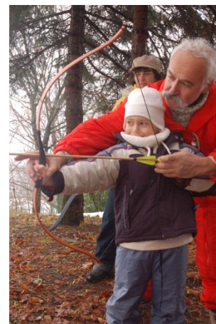
Csúcshegyi Nap 2008. nov. 30