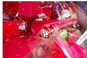
Csúcshegyi Mikuláscsomagok, 2009.