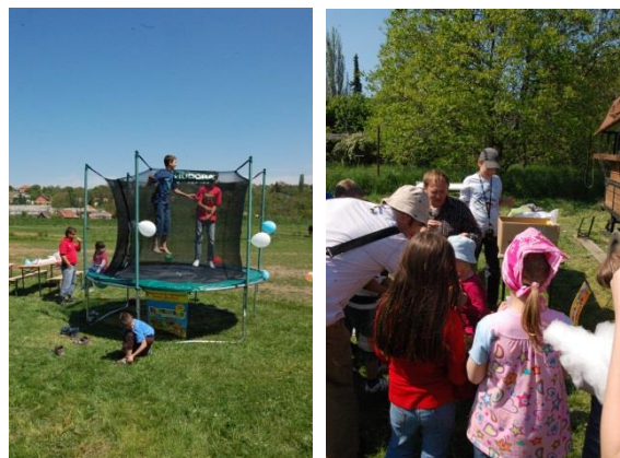
Szomszédok nap 2011. máj. 7.