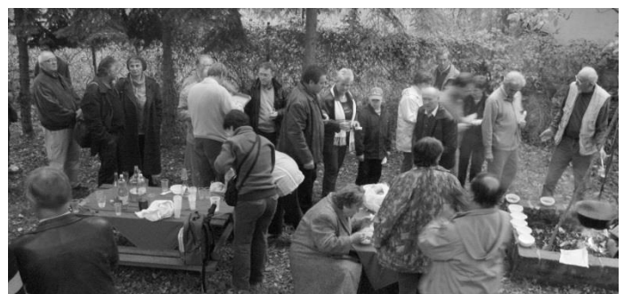
Hegyi vacsora 2007. okt.27-én

A csomagokat karácsony előtt vittük ki a rászorulók címeire.