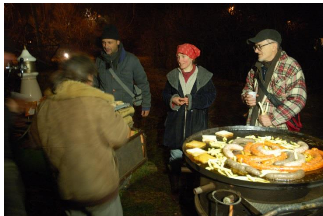
Csúcshegyi Betlehem, 2013. dec. 23.