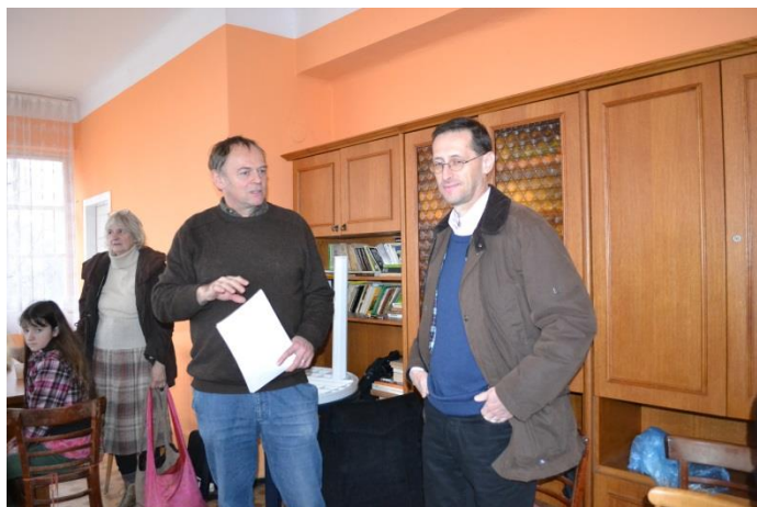
20 éves az egyesület rendezvény, 2014. dec. 7.