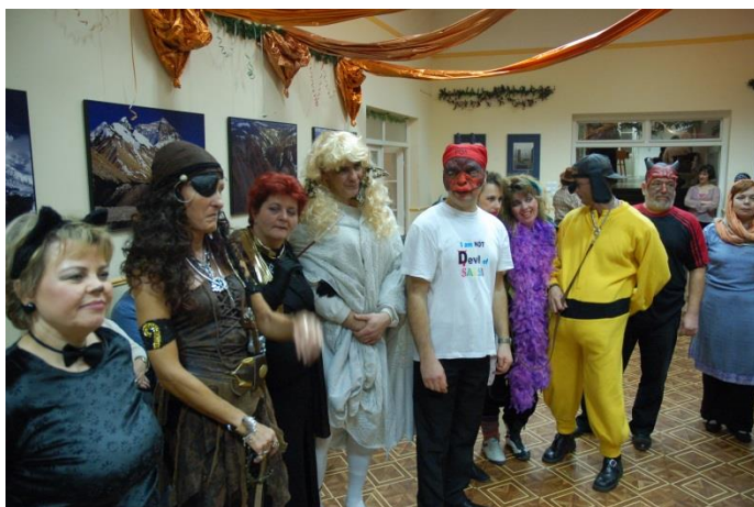
Óhegyi farsang, 2008. febr. 2.