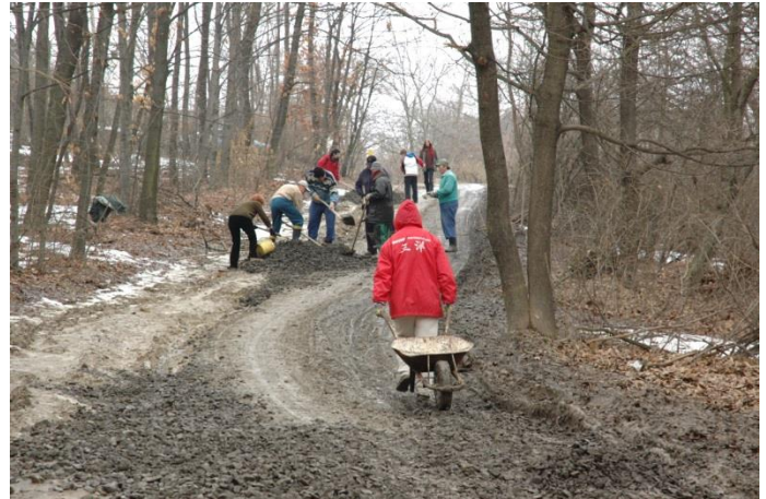
Közös útjavítás a Menedékház út végén 2006. márc. 18.

Az önerőből leaszfaltozott Erdőalja – Menedékház összekötő erdei utat a gázvezeték beruházással tönkretették. Az egyesület az önkormányzattól javítóanyagot kért és a lakókkal javította az utat. Ez volt az utolsó javítás az úton, lassan 9 éve.