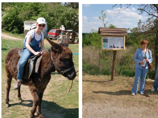
Csúcshegyi majális és tanösvény avatás, 2012.05.07.