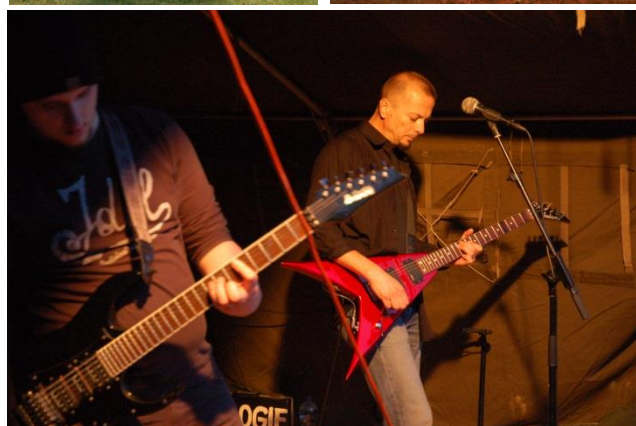
Majális 2014. máj. 4.