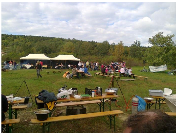
Háromhegyek napja, 2014. szept. 27.