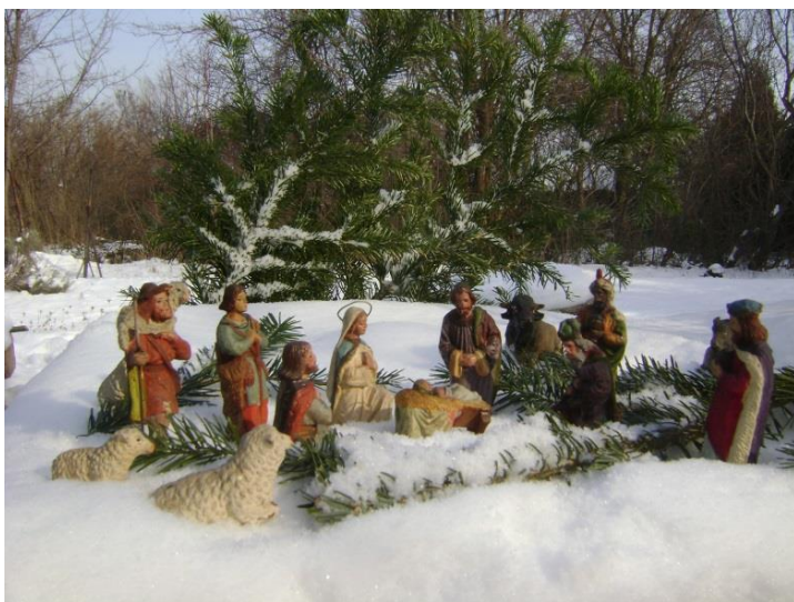
Betlehem a Csúcshegyi Káponánál

Minden kedves lakótársnak Békés Karácsonyt és Boldog Új Évet Kívánunk!