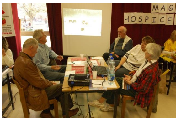
Civil Nap 2010. okt. 2.