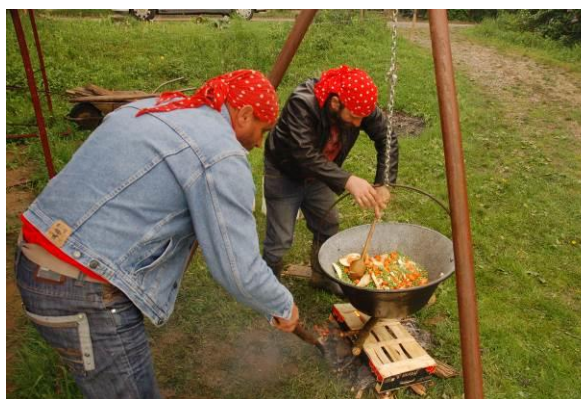
Indul a ragu