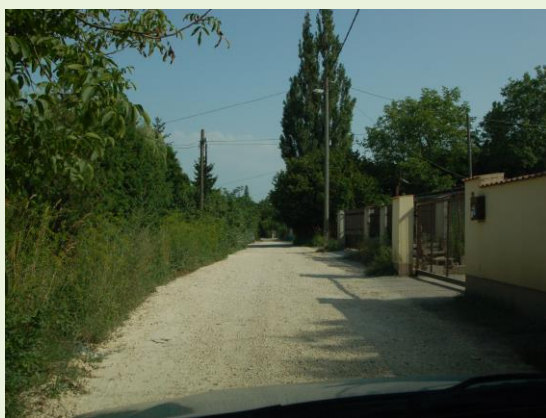
Útjavítás után 1 nappal

Furcsa dolog, hogy útépítő és kivitelező szakemberek munkáját kell kritizálni, de évtizedek óta tanúi vagyunk a jó szándékú útjavításoknak, melyek eleve eredménytelenségre vannak ítélve. Két évtized alatt az út (gödrös) járószintje a folyamatos ráhordások miatt 30 cm-vel került magasabbra, a hegy felől lassan árok alakul ki, az egykori magas kerítések egyre alacsonyabbak.