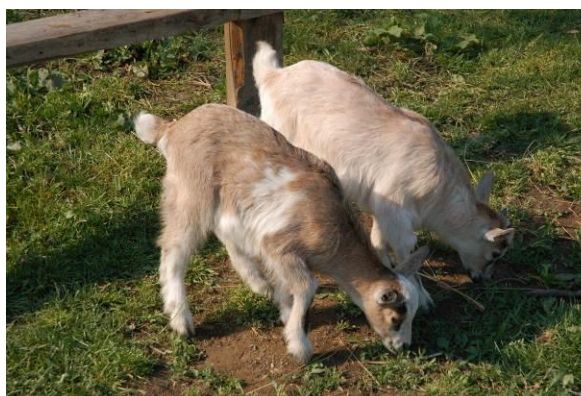
Gidák az állatsimogatóban