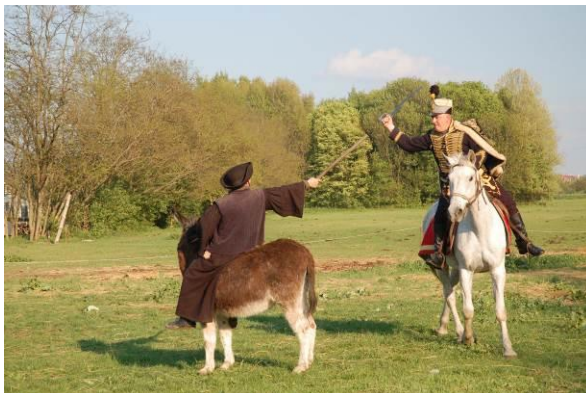
Betyár-bojtár húzogatja a huszár bajszát

A Menedék a Csúcshegy Barátainak Egyesület időszaki kiadványa V. évf. 1. sz. 2015. június