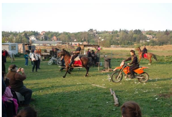
A ló jobban fordult