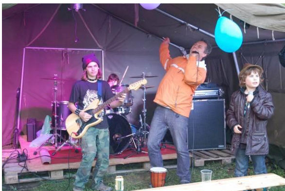
A Dénes gyerekek tini elő-zenekara