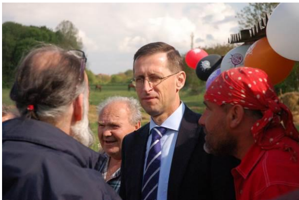
Képviselő a választók között

A Menedék a Csúcshegy Barátainak Egyesület időszaki kiadványa V. évf. 1. sz. 2015. június