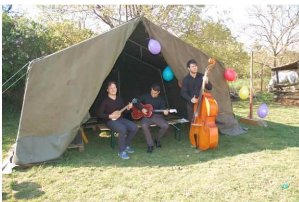
A Patonai zenekar