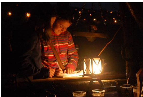
Standolás a büfében