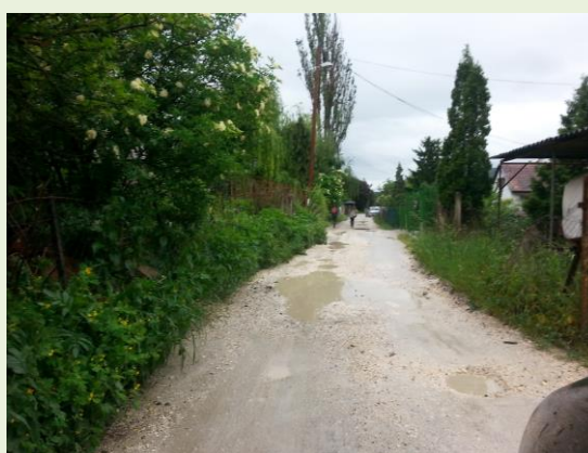
– Útjavítás után 1 héttel

A nem burkolt utak megfelelő állapotban tartásának alapszabálya, hogy kis döntéssel a vizet az út közepén kialakuló kátyúk helyett oldalra levezetik, ahol lehet, ott árokba kivezetik, vagy hosszanti lejtetéssel a kivezetésig viszik. Ehelyett csak poros murva ráhordás van, a kátyúk 1 hét alatt kialakulnak.