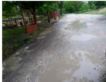
Palotai Ágnes képei az „Álomvölgy”-ről