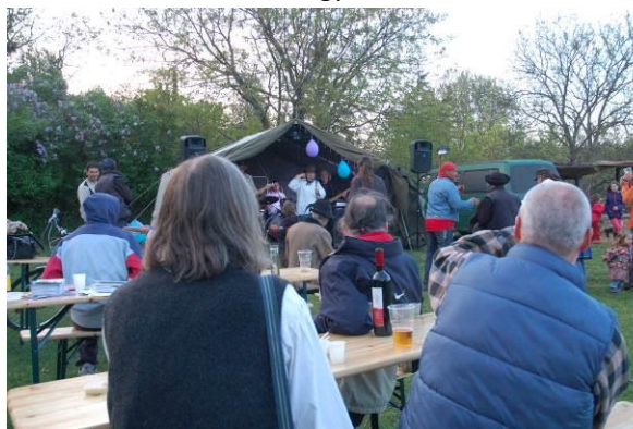
Kezdődik a zene-bona