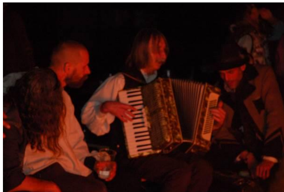
Szól a billentyűs/gombos/tangóharmonika