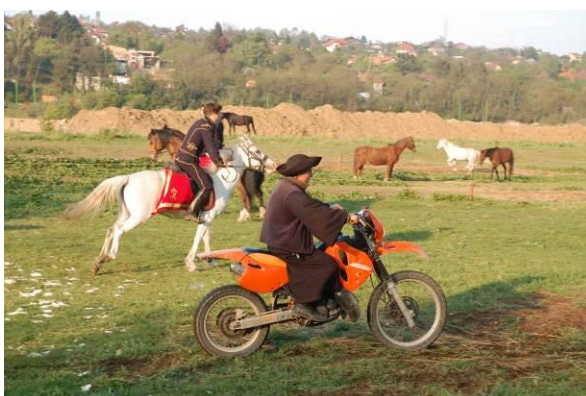
Egyszerre indulnak a lóerők