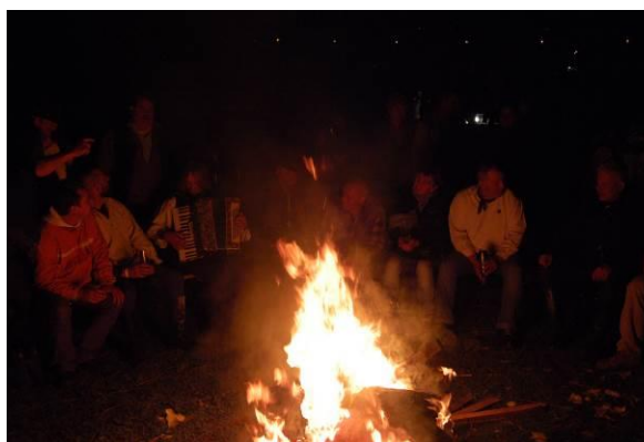
...és a tűz lassan kialudt...