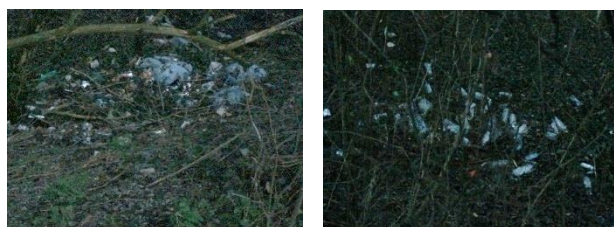
purgamentum vulgaris MOns Culmen