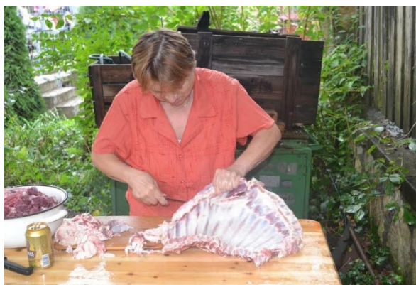
Indul a palóc gulyás