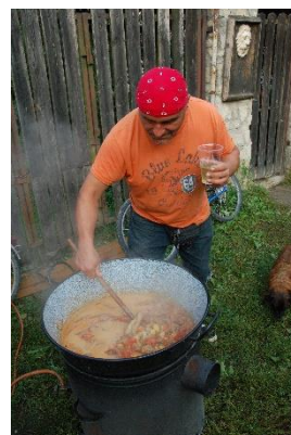
... már rotyog