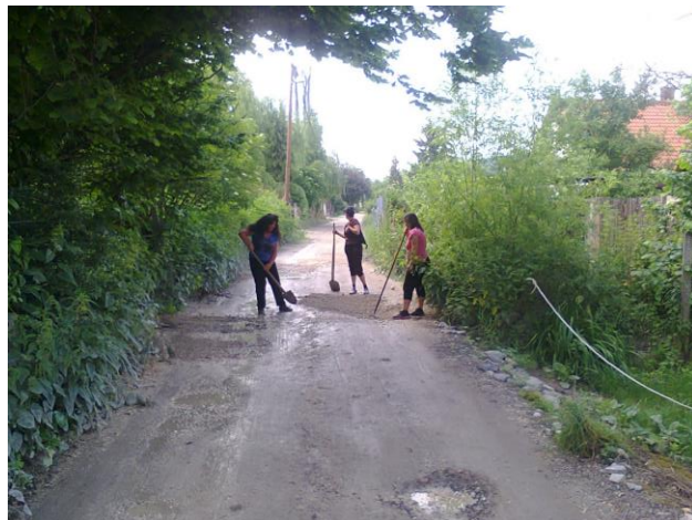
Solymárvölgyi útjavító Amazonok

Reméljük sokáig megmarad ilyen állapotban és ezzel európai fővárosunknak ismét élhetőbb lett egy kis utcája.