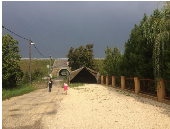
A felállított sátor

A Menedék a Csúcshegy Barátainak Egyesület időszaki kiadványa VI. évf. 1. sz. 2016. szeptember