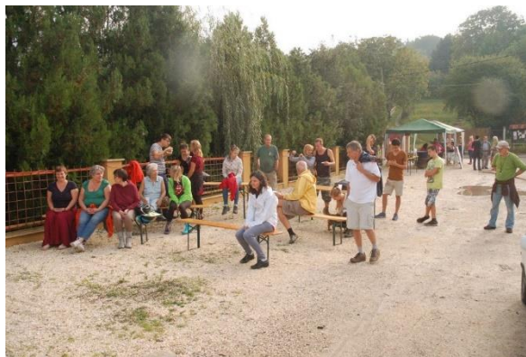
A Patonai zenekar, táncosok és a közönség