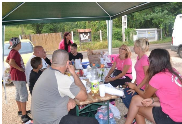
Duhajdombi helyes menhelyesek