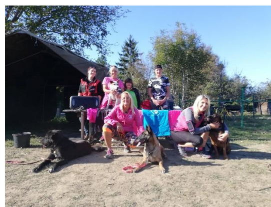
Az Ürömi Duhajdombi Kutyaiskola – felelős állattartás