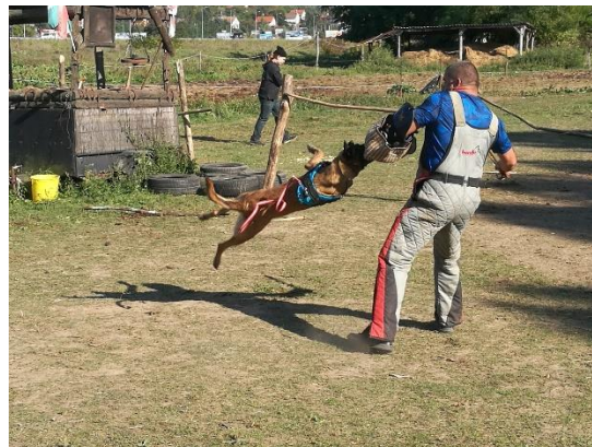
Az Ürömi Duhajdombi Kutyaiskola őrző-védő bemutatója