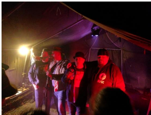
Az Útonállók zenekar koncertje