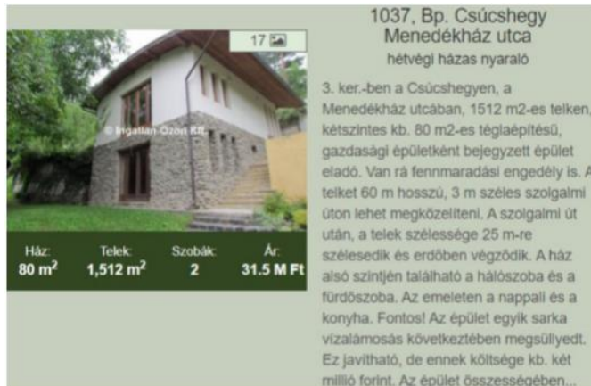
Pörög az ingatlanpiac

Ezekon felül korlátozza a tulajdonjog teljes körű gyakorlását A Csúcshegy területén fennmaradt geotechnikai kategorizátlanság, ami mulasztásos jogsértés a 2014 január óta hatályos előírásával szemben, amit a TSZT a kerület építési szabályzatában ír elő rögzítésre, ami a hatályos TSZT 2017-ben is szereplő kitétel: 109. old: " Az OTRt rendelkezése szerint a földtani veszélyforrás területének övezetét a településrendezési eszközökben kell a tényleges kiterjedésnek megfelelően lehatárolni. - A geotechnikai vizsgálatoknál érdemes megemlíteni a csapadékvíz elvezetés megoldatlanságát, amit a terület rendezésétől várhatunk. A Csúcshegy városrész felett húzódó övások még 1938-ban épült meg, de azóta benőtt az erdő. A klímaváltozás miatt a villámárok gyakoriságára számolni kell. Alattunk jelentős infrastruktúra kell, hogy védelmet kapjon a mi épületeinket nem is nézve. Sajnos már ma is vannak érintett ingatlanok, amik a hegyoldalon lerohanó víz által fenyegetettek: