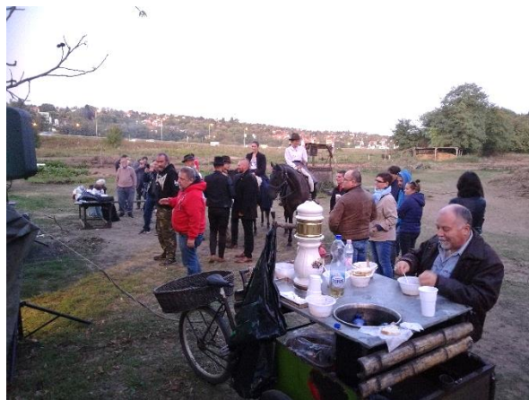
Birkapörkölt készítők és pörköltözők