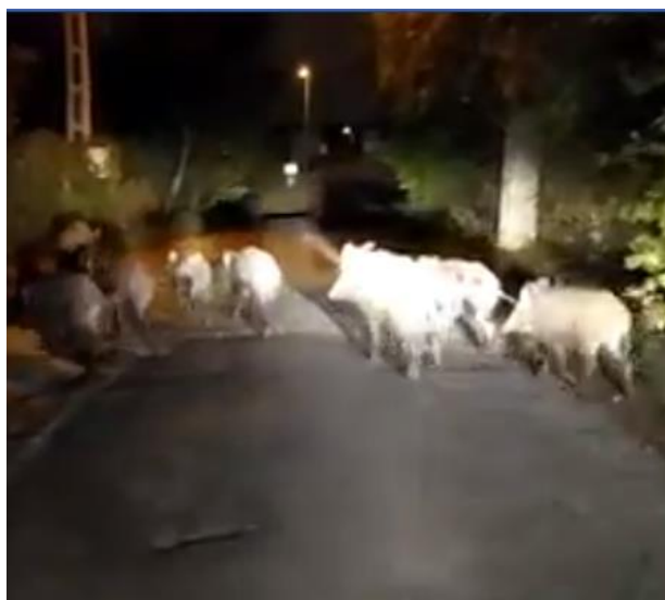
Csúcshegyi éjszakai élet

Éppen ebben a közegben érdekesek, inkább tragikomikusak a hatóságok válasza. No de lássuk, hogyan gondolkodnak, Budapestről, az európai főváros nyílt állatkertjéről: