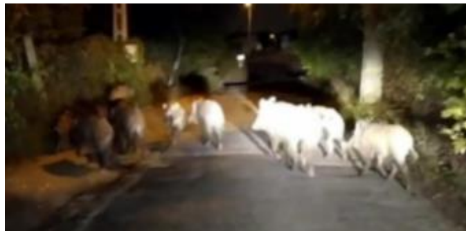
...és a hazai malacok

Malaca van a Csúcshegynek remélhetőleg a város változásaiban is! Egységes fellépésre törekedve a terület fejlesztési igényei mentén sikerült a felálló városvezetéssel december 2-án leülni, ahol meghallgatták a problémáinkat, az ellenérzésünket a mellőzöttségünkben a fejünk felett történő várostervezésről. Jeleztük, hogy régi lakosságú városrészünk, régi igényekkel van jelen. Nem kérünk semmi extra ellátást, csak amit már minden elkerített zöld felület megkap lassan. Ivóvizet, a felszínmozgásosság kategorizálását és a már a 80-as években a főváros Általános Rendezési Tervében leírt családi házas övezet kialakítását szeretnénk. Itt nincsenek befektetők nem társasházakkal akarjuk eltakarni a fölénk magasodó Csúcs – hegyet! A Csúcshegy eleve 100m-rel alacsonyabban fekszik a legfelső utcában is. Itt pedig LKE-3 övezet a kívánatos, maximális beépítési magasság 6.5m. Nem ígértek semmit, de meghallgattak és felveszik a kapcsolatot a fővárossal, a fejlesztési igényeinkkel kapcsolatos helyzet tisztázására. Megértették az érveinket.