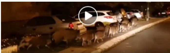
A Felső Zöldmáli útiak