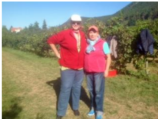
Közös Szüret az Óhegy Egyesülettel