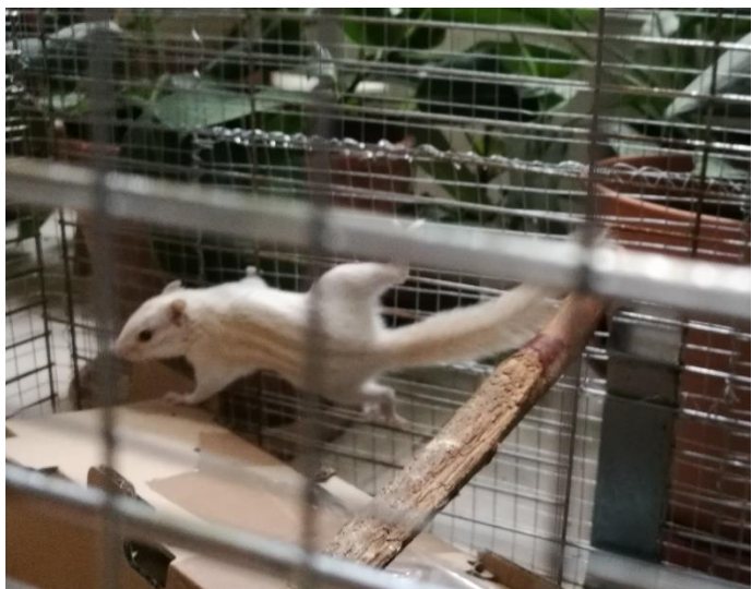
Csúcshegyi csíkos mókus

Egyébként a Himalájától délre valóban laknak csíkos mókusok, lehet, hogy egyszer ők is jönnek majd látogatni.