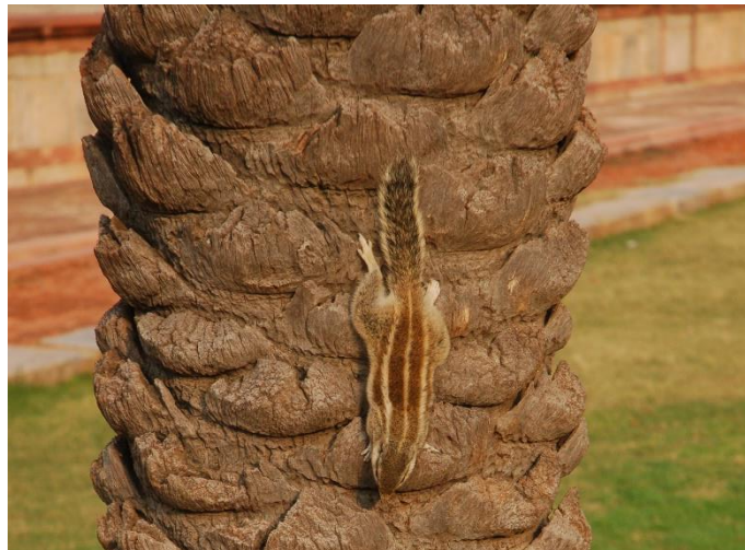
Indiai csíkos mókus (Delhi)