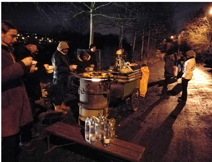
Sül a krumpli, forr a bor