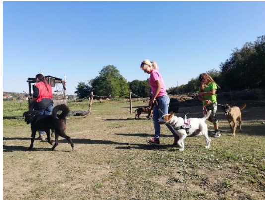
Az Ürömi Duhajdombi Kutyaiskola engedelmességi bemutatója