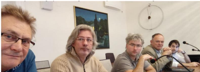
Küldöttségben dec. 2-án

Ígéretet kaptunk a folyamatos egyeztetésre a következő évben és kértek tőlünk egy anyagot a jogsérelmeinkre a területen. Pár példa ezekről: Talán még nem mindenki tudja, hogy ma Mk2 beépítésre nem szánt mezőgazdasági kertes külterület vagyunk, fejlesztésre szántság nélküli státuszban. A rendszerváltást pedig még így éltük meg. (Nem mondhatjuk el, hogy a magántulajdonaink a haszonélvezői közé tartoznak)