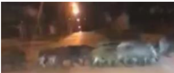
A Harsánylejtős konda

Nem csak a Csúcshegynek van malaca! – ez viszont a budai területet ellepő vaddisznókról szól! A Sasadon, Gellérthegyen, Felső Zöldmáli útin is már kondák járnak az utcákat, ahogy kerületünkben a Hajógyári szigeten is most lótták ki az oda magát bevett állatokat. A Csúcshegy felső utcáiban évtizede mozgó vadak, mára már az alsó utcákban pusztítanak. Egy konda csak aludni jár haza a Harsánylejtő játszóterének környékén töltve a nappalokat. Felmerül a kérdés a város szerte észlelhető beköltözésük okán: Minden rendben van az erdei etetéssel? Biztos le kell hozni a hegyről a régi turista út mentén az etetőket a Rozália sor magasságáig?