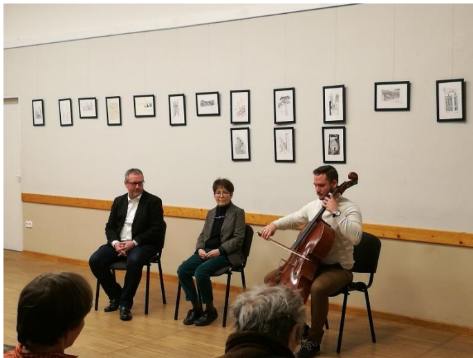
A kiállítás megnyitóján